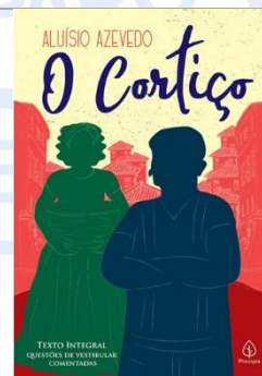
O Cortiço - Aluísio de Azevedo - Editora Ciranda Cultural