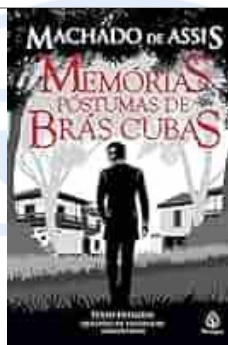
Memórias Póstumas de Brás Cubas - Machado de Assis - Editora Principis