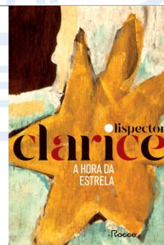
A Hora da Estrela - Clarice Lispector - Editora Rocco