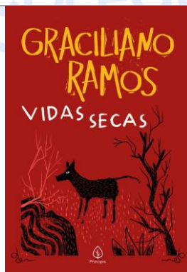
Vidas Secas – Graciliano Ramos