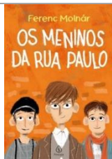
OS MENINOS DA RUA PAULO – Ferenc Molnár - Editora Príncipis