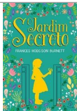
O JARDIM SECRETO – Frances Hodgson Burn - Editora: Principis