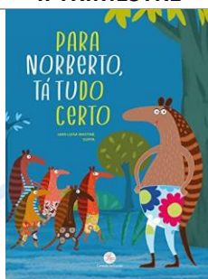
Para Norberto, tá tudo certo – Lara Luisa Mastine – Editora Ciranda Cultural.