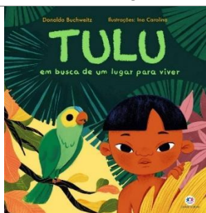
Tulu em busca de um lugar para viver – Donald Bichweitz – Editora Ciranda na Escola.