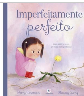
Imperfeitamente perfeito – Perry Emerson/ Hoang Giang – Editora Ciranda Cultural.