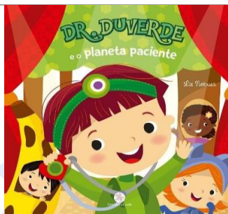
Dr. Duverde e o planeta paciente – Lie Nobusa - Editora Ciranda na Escola.