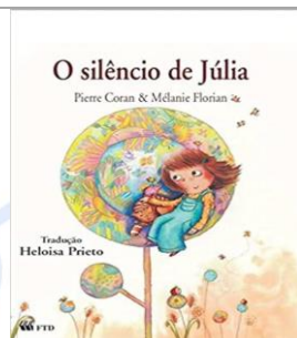
O silêncio de Júlia – Pierre Coran e Mélanie Florian - Editora FTD.